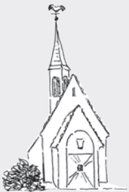
Heilig Geist Stedinger Str. 52 26135 Oldenburg