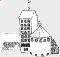
St. Willehad Eichenstraße 57 26131 Oldenburg