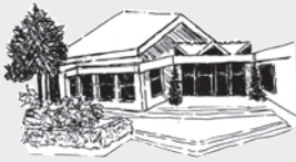
St. Stephanus Windthorststr. 36 26129 Oldenburg